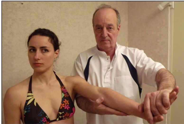
ROTATION DE TÊTE DU CÔTÉ OPPOSÉ AU POIGNET TESTÉ SANS VERSION DES YEUX.

L'opérateur demande au sujet de réaliser une rotation de la tête du côté opposé au poignet testé sans aucune version des yeux et n'observe pas de renforcement de la force des extenseurs du poignet.